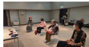
10/12（水） 豊田殿姫チンドン（崇化館）