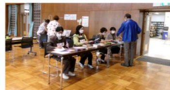
10/8（土） サロンふじなん（藤岡南）