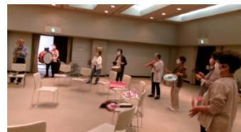
10/5（水） 豊田殿姫チンドン（崇化館）