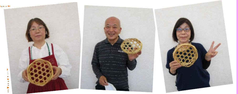
少しずつ形が違って味わい深いです！嬉しくてついピース！