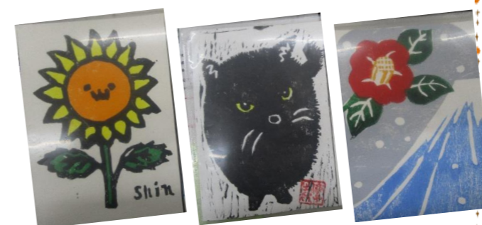
彫って彫って…ようやく作品が仕上がりました！