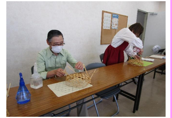
完成まであともう少し！