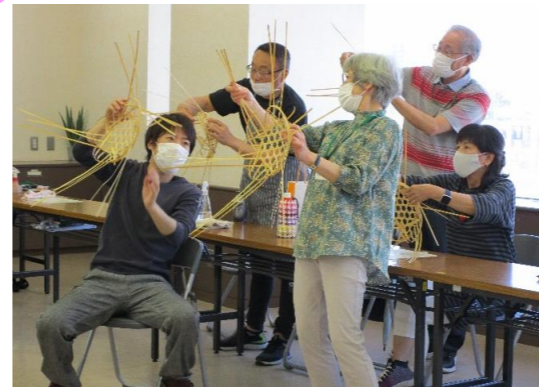
分からないところは教え合って、助けられたり助けたり…