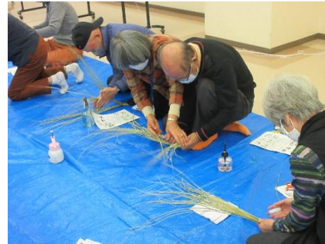
▲縄をなうことは初めての受講者が多く、ほどいてやりなおす場面もありました。この後は松、梅、千両、金色に輝く松ぼっくり、扇などたくさんの飾り付けが待っています。そちらも講師皆さんの指導と受講者の熱い思いが重なり豪華にできあがりしました。