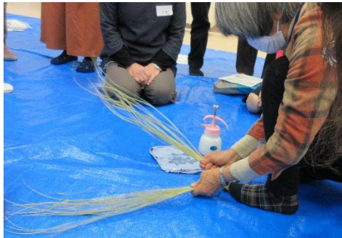
▲講師のお手本、わらを足で押さえて三つに分けてからなっています。