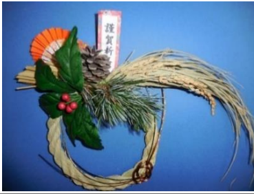
▲見本 稲穂もついて、飾りも豪華なしめ縄です

とよたシニアアカデミー はじめの一步講座 「地域講師から教わるしめ縄づくり」 日時：12月11日(土)10:30~12:00 会場：活動センター ホール 講師：前林地域講師の会「女川はてなの会」 参加者：24人(募集は20人でしたが人気の為定員を4人プラスしました。)