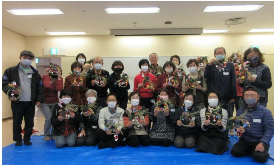
▲皆、笑顔で完成しました。世界に一つだけのしめ縄！お正月が楽しみです♡