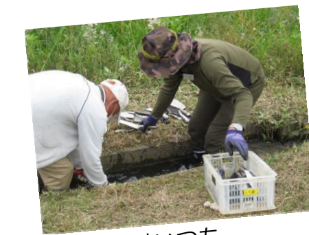
道具はいつも きれいにしています